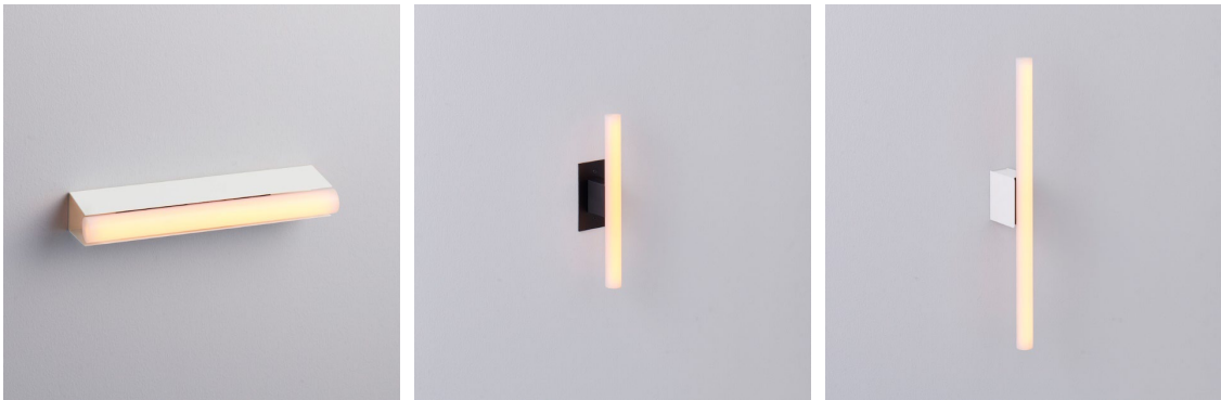
写真左から、Ori オリ、Ita イタ、Haco ハコの、それぞれ代表的な製品

LINEA LAMP を組み合わせることができるので、多彩なバリエーション展開が可能です。シックからカジュアルまで、さまざまなシーンで威力を発揮します。器具のカラーは、マットライトグレー、マットダークグレーの2色です。